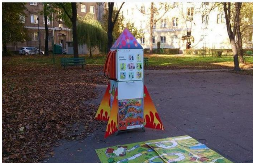
Rakieta edukacyjna Fundacja Nowe Centrum Kraków