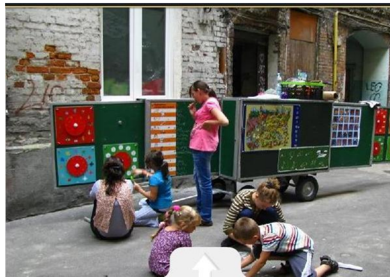
Mobilna szkoła, GPAS Warszawa